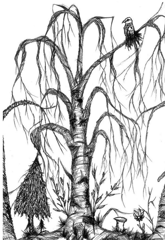
Isabela H. 9. B

ročník: 4, č. 2/2022-23, počet výtisků 235, vychází duben 2023, samostatně neprodejně