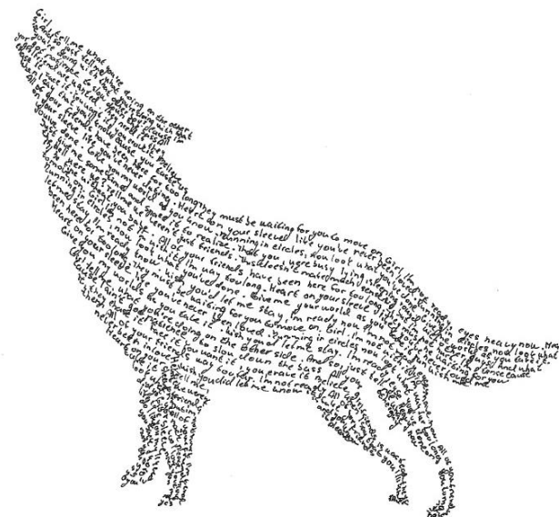
Róza 9. B

Obraz zimní krajiny přímo před ní byl tak nádherný, až jí to navodilo všechny tyto myšlenky a donutilo ji to z pouhého pohledu plakat.