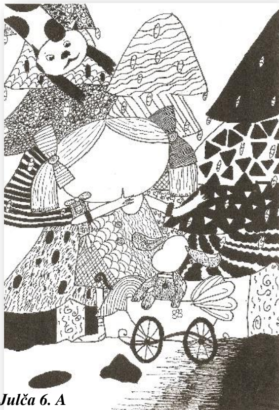
Julča 6. A