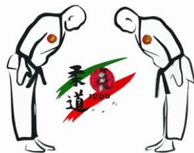
Vojta, Viktor 6. B

"Nebaví mne rozcvičky, jsou vždy moc dlouhé."