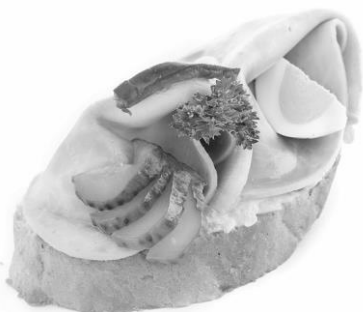
Lucka 6. A